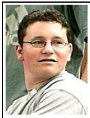
JE- Vize- Europameister JM- Europameister