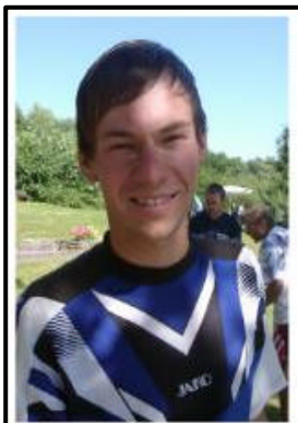
JM- Europameister Deutscher Einzel- Jugendmeister