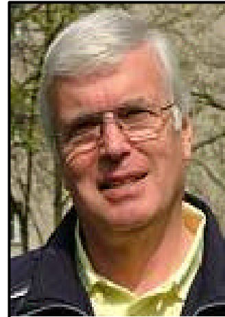
Chef de Mission